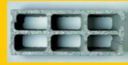
Bloc 500x200x250 : 21 kg

Palette Blocs à joint mince avec blocs ajustables®