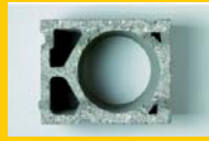
Bloc angle 250x200x250 : 12,5 kg

Palette de Blocs à joint mince accessoires comprenant : blocs borgnes, ajustables® et modules.